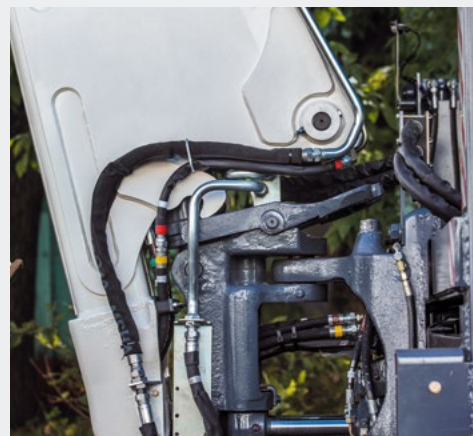
Двойной транспортный фиксатор стрелы - это уникальное устройство для транспортной блокировки, предохраняющее экскаваторную стрелу от опускания и поворота. Не требует выхода оператора, поскольку полностью управляется из кабины.