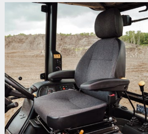
Комфортабельное сиденье оператора оснащено высокой спинкой с подголовником, подлокотниками и инерционным ремнем безопасности. Обладает всеми необходимыми регулировками.