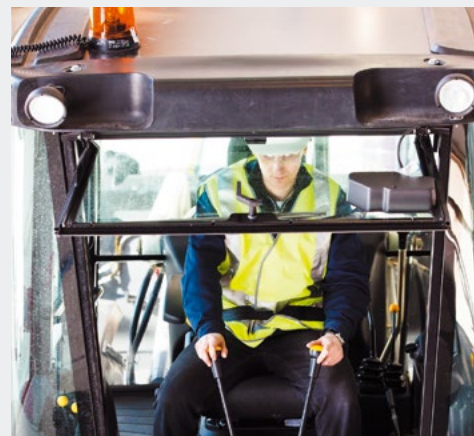
Цельное заднее окно легко открывается и фиксируется в открытом положении, создает удобный козырек от дождя, обеспечивает комфортную работу в теплый период.