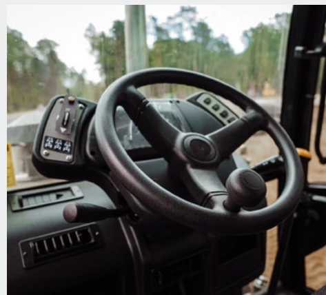
Рулевая колонка регулируется по углу наклона. Удобное рулевое колесо не требует приложения значительных усилий при маневрировании. Имеет рукоятку для облегчения управления одной рукой.