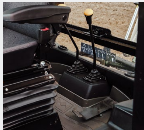
Эргономичная педаль для управления гидромолотом и выдвиганием телескопической рукояти. Способствует значительному снижению утомляемости оператора при работе.

Синхронизированная 4-ступенчатая коробка передач Synchro Shuttle с сервоуправлением позволяет переключать передачи во время движения, менять направление передвижения машины.