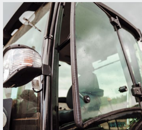
Верхние части дверей могут быть полностью открыты и зафиксированы в этом положении для лучшей вентиляции.